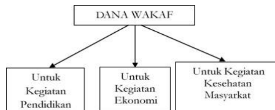
Gambar 2 : Peruntukan Wakaf di Yayasan Bina Mandiri Ternate

Pada saat ini hasil pengelolaan wakaf produktif di yayasan belum pernah digunakan untuk kegiatan bantuan kepada fakir miskin, anak terlantar dan kemajuan perekonomian masyarakat sekitar, akan tetapi bantuan beasiswa bagi siswa kurang mampu menggunakan dana BOS dan bantuan ekonomi bagi warga sekitar yang memerlukan menggunakan dana sumbangan dari kelas yang dikumpulkan tiap tahun. Hal ini seperti yang disampaikan pembina yayasan H. Rusydi Rusli, beliau mengatakan bahwa: “Hasil pengelolaan wakaf produktif di yayasan belum pernah digunakan untuk kegiatan bantuan kepada fakir miskin, anak terlantar dan kemajuan perekonomian masyarakat sekitar. Beasiswa bagi siswa kurang mampu menggunakan dana BOS dan bantuan ekonomi bagi warga sekitar pada saat baksos menggunakan dana sumbangan dari kelas yang dikumpulkan tiap tahun”.